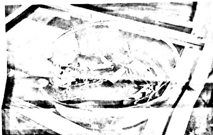
Rechts: schaalpje met rupsen uit het Poppenhuis.